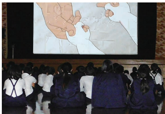
映画を真剣に見る児童のみなさん (大莞小学校)