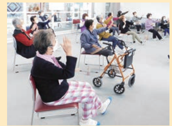
音楽に合わせて楽しく体操