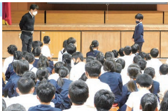
映画を上映していただいた方に代表してお礼の言葉 (木佐木小学校)