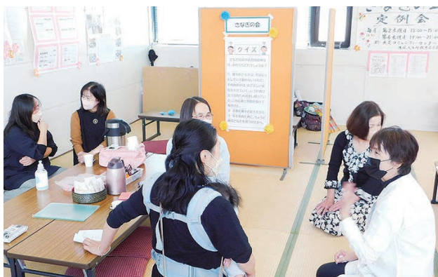
茶話会の様子（さなぎの会～不登校を考える親の会～）