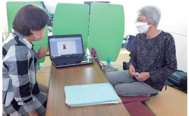
パソコンでお絵描き体験（げんき会）