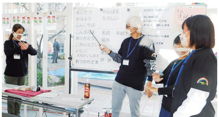
手話であいさつ♪（手話サークル「なないろ」）

発行者：社会福祉法人 大木町社会福祉協議会 住所：三瀨郡大木町大字八町牟田 538-1(アクアス奥) TEL 0944-32-2423 / FAX 0944-33-2015 https://www.ookisyakyou.info