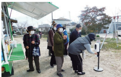
手指消毒をして新型コロナウイルス感染予防

令和2年10月30日から大溝校区の十間橋・横溝本村・五反田・上白垣の4地区で毎週金曜日にグリーンコープ生活協同組合による移動販売がモデル事業として始まりました。