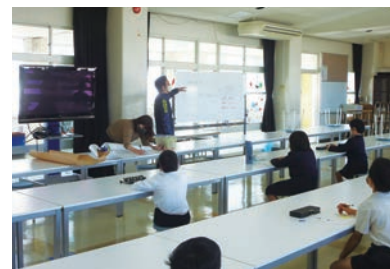
真剣に話を聞く4年生の皆さん

10月27日、大莞小学校の4年生と一緒に、福祉学習を行いました。小学校では福岡県社会福祉協議会が発行している福祉教材「とも生きる」を活用して、地域における福祉について、学習が続けられています。今回の授業ではグループワークを取り入れ、地域に住む障がいのある人が、生活の場面でどのような事に困るのかを児童のみなさんに考えてもらい、それぞれの意見を発表してもらいました。先生から、「色々な意見を聞き、みんなで考えることで子どもたちの障がいに対する理解が深まりました」と感想をいただきました。