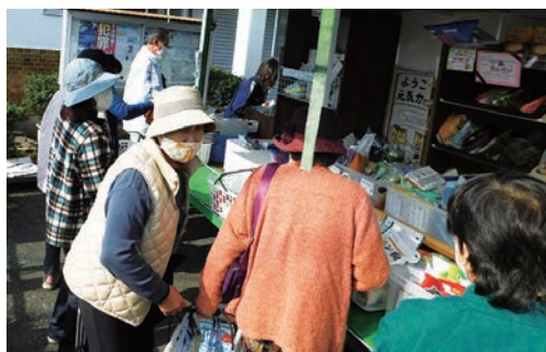
横溝本村地区の様子