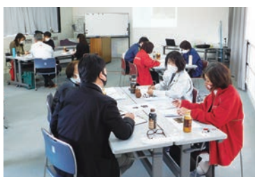
事例に対する意見交換

研修を受け、被災された人の気持ちに寄り添い、ひとつでも多くの困りごとを引き出し、課題解消へ導いていくこと等改めて災害時における当社協の役割の重要性を感じました。