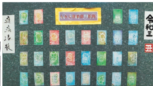
個性豊かで素敵な版画が完成