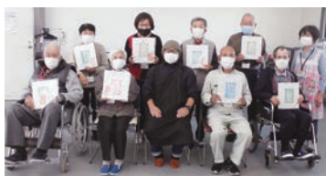
作品を手に記念撮影