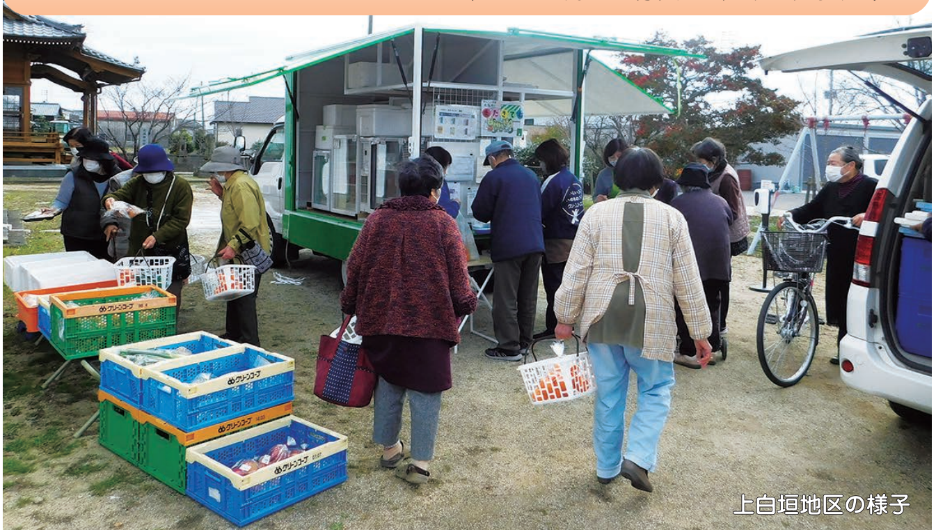
上白垣地区の様子

地域の皆さんが交流できる安心して楽しい買い物支援が始まりました ～大木ささえ隊 大溝校区部会の取り組み～