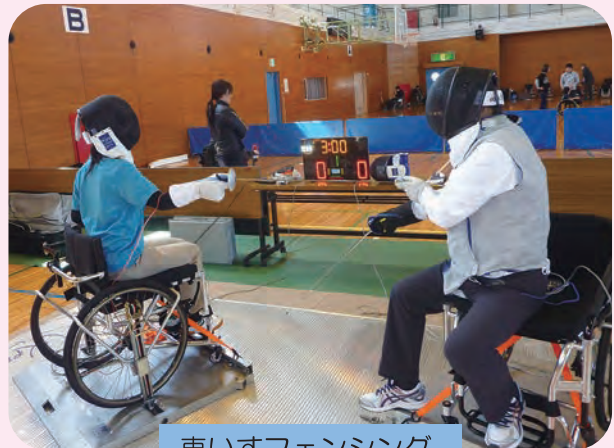
車いすフェンシング