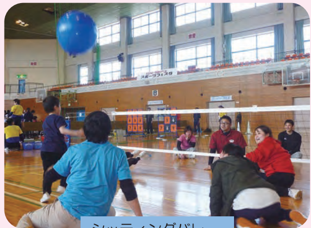
シットイングバレー

障がいの有無に関わらず筑後地区の多くの方々に参加を呼びかけ、障がい者スポーツを体験してもっと身近にパラスポーツを感じることが出来るよう開催いたしました。関わる機会が少ない競技の体験や障がい者アスリートとの交流もあり楽しい時間を過ごしました。