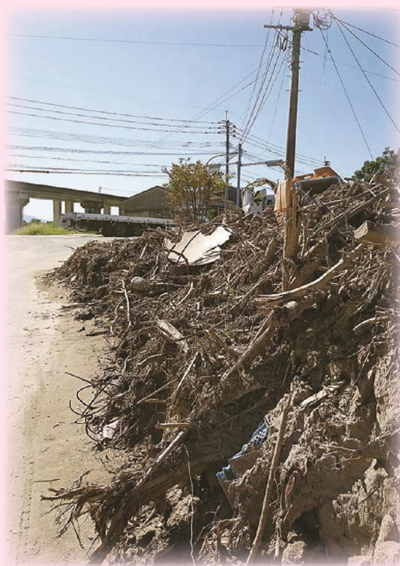
今もなお道路脇に高く積み上げられた土砂

町民の方、町職員、社協職員でボランティア活動に行きました。被災された方の遺品を探し洗い流す作業、家の中や周辺に堆積した土をかき出す作業を行いました。亡くなられた方のご冥福と被災された方々の一日も早い復興を祈願いたします。